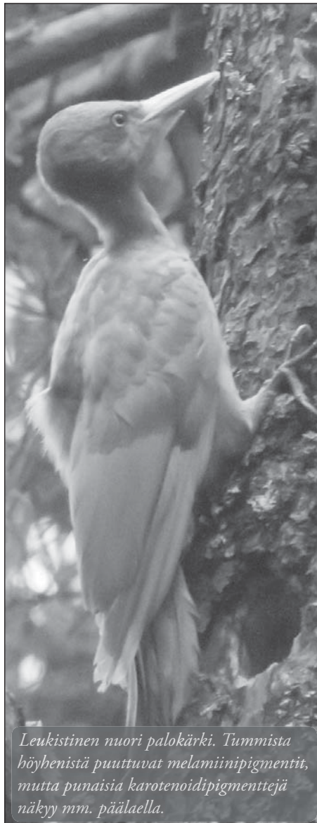
Leukistinen nuori palokärki. Tummissa höyhenistä puuttuvat melamiinipigmentit, mutta punaisia karotenoidipigmenttejä näkyy mm. pääläella.

Poikkeavat värimuodot ovat perinnöllisiä tummia värejä aikaansaavien melamiinipigmenttien mutaatioita tai ravinteiden puutteesta johtuvia keltaisen ja punaisen karotenoidiväriin häiriöitä. Ne ovat kohtalaisen tavallisia lintumaailmassa. Poikkeaman laatu riippuu siitä, minkä väripigmentin säätelyssä on häiriö. Eläin, jolta väripigmentit puuttuvat kokonaan, on harvinainen albiino. Eri