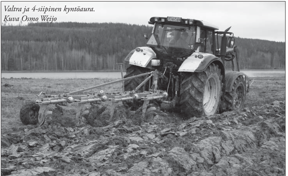
Valtra ja 4-siipinen kyntöaura.

kaasti kokeiltu. Kaikille pelloille lautasäe ei kuitenkaan sovellu ja muokkaustulos ei täysin korvaa kyntämistä, joten kyntöaurat eivät vielä jouda museoon. (V. Koskinen)